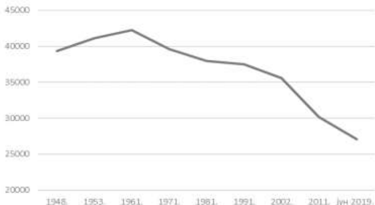
Табела: Кретање броја становника у општини Оџаци према пописима од 1948-2011. са проценом за јун 2019. године

Извор: РЗС, Упоредни преглед броја становника 1948, 1953, 1961, 1971, 1981, 1991, 2002 и 2011. године и Процењен број становника Републике Србије, јун 2019.